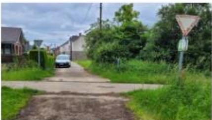
photo 22 vue sur route de campagne à gauche