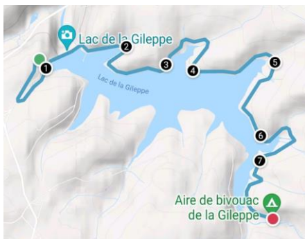
Carte du circuit aller

Informations détaillées : Parcours du parking de la tour panoramique à l'aire de bivouac de la Gileppe