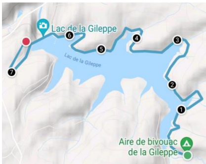
Carte du circuit retour